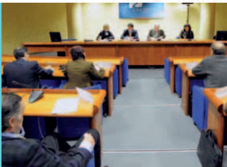
Euskadiko Gizarte eta Ekonomia Arazoetarako Batzordearen Osoko Bilkura