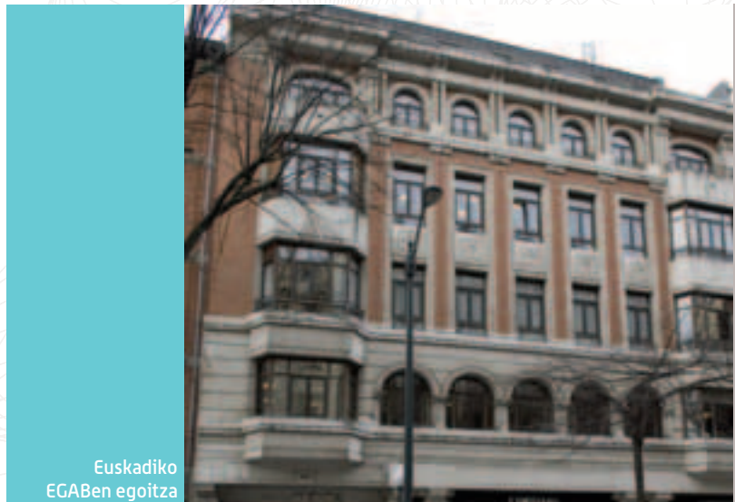
Euskadiko EGABen egoitza