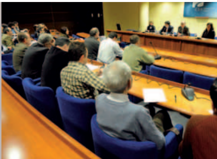
Euskadiko Gizarte eta Ekonomia Arazoetarako Batzordearen Osoko Bilkura