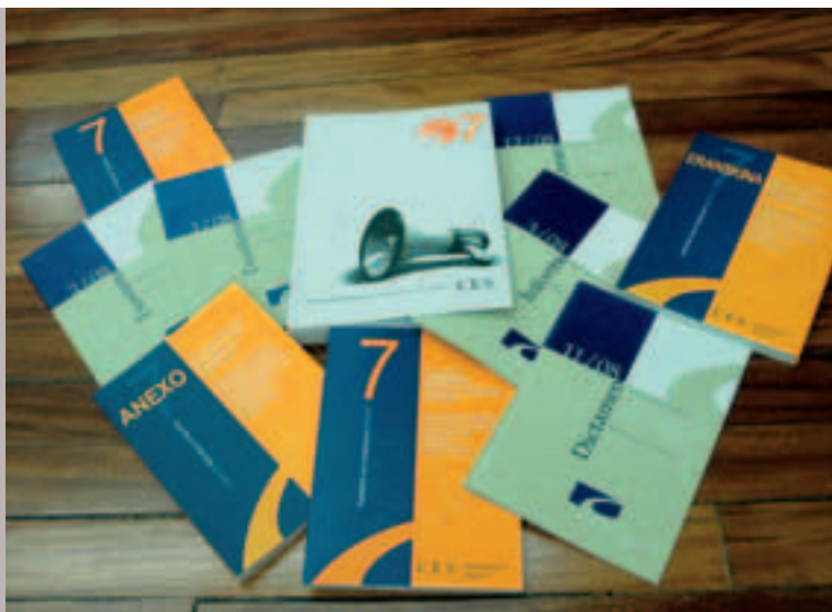
Euskadiko EGABen argitalpenak

eta sozialen aldetik proposamenak definitzea da ekonomia-, gizarte- eta ingurumen-helburuak eta –konpromisoak integratuta planifikatzeko EAEko Garapen Iraunkorraren etorkizuneko Estrategian.