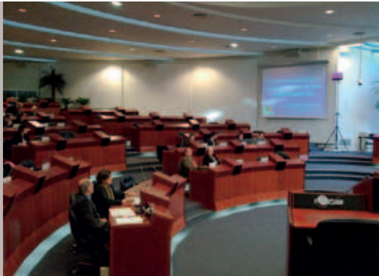
RTAren asanblada. Rennes, Frantzia

Saioaren lanak Akitaniaren EEGABrekin Baionan azaroaren 20 eta 21ean egin beharreko hurrengo bilera bateratua prestatzera bideratu ziren. Bileraren gai-zerrenda aztertu eta horri ikus onetsia emateaz gain, 1990-2006 eboluzioaren ikuspuntuan fluxu-datu eskuragarrien ondorioz sortutako joerei buruz eztabaidatu zen eta epe laburrean nahiz ertainean joeren