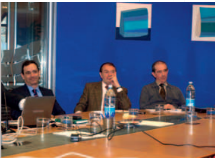
EGABen lan batzarra